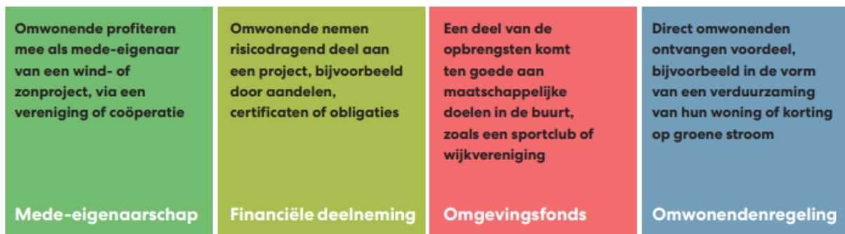
Figuur 1: Participatiewaai

Juridisch (mede-)eigenaarschap is een vorm van actieve participatie. Hierbij zijn bewoners en/of ondernemers uit de lokale gemeenschap collectief betrokken als (mede-)eigenaar van zonnenvelden of windmolens. Ze beslissen mee over het project. Bijvoorbeeld over de fysieke vormgeving van het project en de landschappelijke inpassing, de bestemming van winst, dividend en financiering.